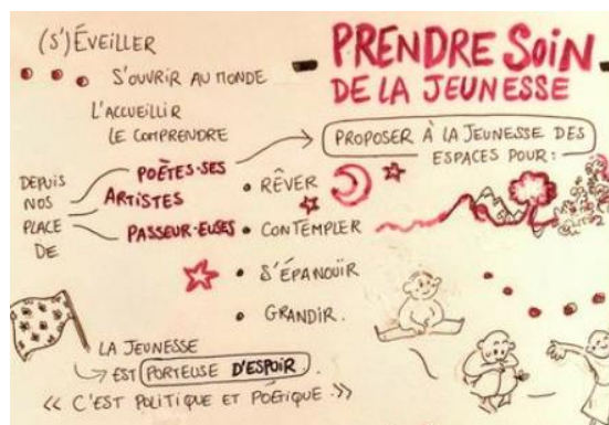
Facilitation graphique réalisée lors de la Rencontre nationale