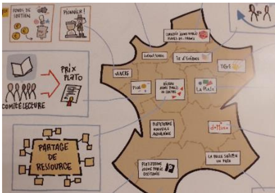
Carte des plateformes Jeune public / Scènes d'enfance – ASSITEJ France

Le Réseau est adhérent et participe à la dynamique impulsée par l'association Scènes d'enfance au niveau national. Il participe notamment par le biais du Conseil ou de la coordination/animation à des rencontres d'information et d'échanges, à des temps de formation avec un expert ou entre pairs, à des temps de travail... A titre d'exemple, le prochain temps de rencontre et de formation proposé par Scènes d'enfance a lieu le 11 juin sur Paris et traitera du travail en Commission (cadre, méthodologie...).